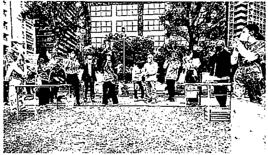
モルックプレイの様子

使用したモルックは現在再開発工中の西新宿5丁目北地区内に再開発以前に生えていたヒマラヤ杉