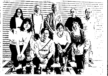
PTA役員の方々と厚生部員

これまでは定期的に厚生部とPTAの交流会も実施しておりましたが、この2年余りはコロナ禍により中断せざるを得ませんでした。