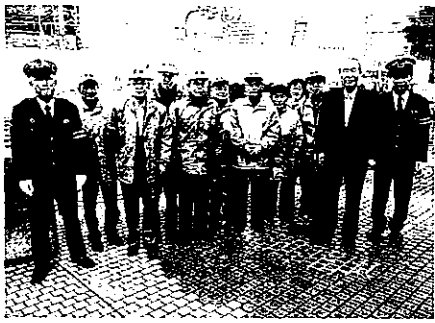
交通安全週間にて

淀橋町会交通部では、令和3年4月、春は10日間と秋の10日間、全国交通安全週間を部員さんと共に活動しました。春は小学校の新生、お年寄りや通勤者の皆さんが交通事故に巻き