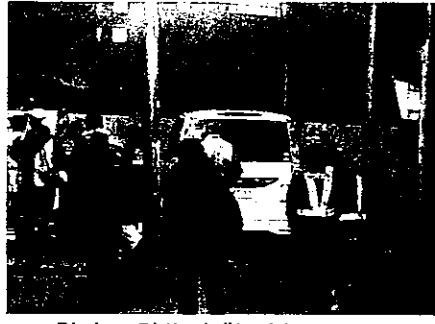
防火・防犯夜警パトロール

令和3年度はコロナ禍で何の活動もできませんでした。本年度は何としても西新宿小学校で10月の中旬(10月16日の予定)防災訓練を行いたいと思っております。現在新宿区の危機管理課、角管出張所などを中心にどのような訓練をするか検討中です。区の情報によりますと、本年度は簡易組立テント、などが追加購入されたようで楽しみにしています。消防署からは起震車、放水車も参加予定です。新宿区医師会からはお医者さん、薬剤師